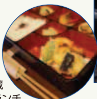
四季の蔵「右近」ランチ