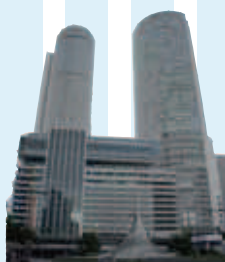
名古屋駅 JRツインタワー

納屋橋のりば 地下鉄東山線・鶴舞線「伏見」駅(7・8番出口)より徒歩8分 地下鉄桜通線「国際センター」駅(3番出口)より徒歩8分